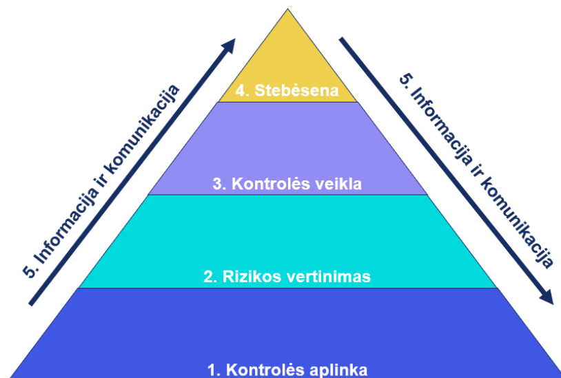
2 pav. Grupės Vidaus kontrolės valdymo sistemos elementai